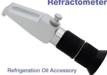
Refrigeration Oil Accessory